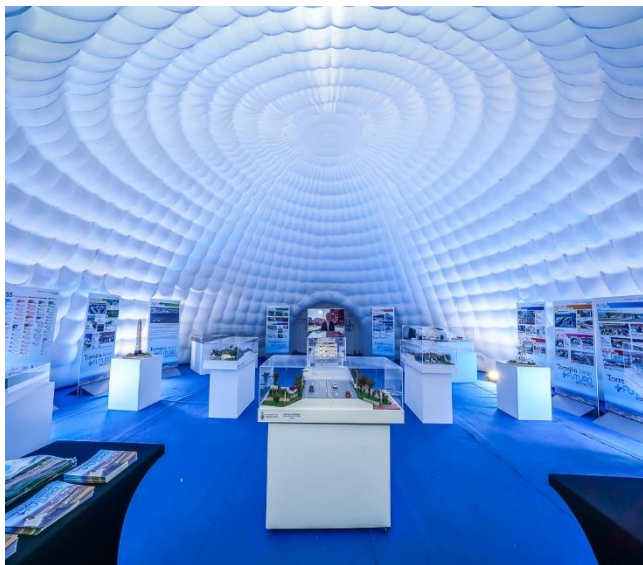
Exposición de maquetas torrejón 2023