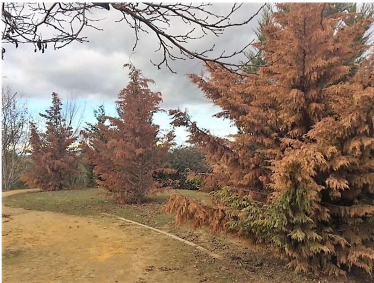
3 árboles secos junto a "Los Cisnes" del Parque La Zarzuela

En definitiva todas las labores de mantenimiento a realizar para garantizar que nuestros ejemplares puedan tener una vida larga y saludable, deben ser cuestiones que nos preocupen. Creemos que quizás a este aspecto tan crucial es al que dedicamos menos esfuerzos. Este déficit de mantenimiento se traduce en que muchos de nuestros árboles enferman o se secan o se tuercen y hay que tomar la decisión de talarlos.