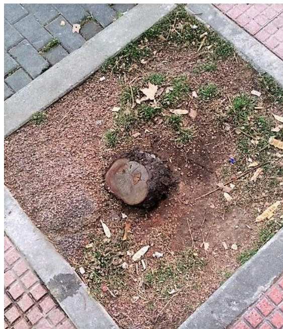
Ejemplares de gran porte talados

Todos ellos han sido víctimas de la misma realidad, que le tienen más apego al ladrillo y al hormigón que a preservar el medio ambiente de nuestra ciudad. Resulta paradójico, por no utilizar otro calificativo más castizo, que Torrejón sea una de las ciudades con el aire más contaminado de España y que en vez de tomar medidas tendentes a luchar contra esta grave realidad a vds. solo se les ocurra talar árboles.