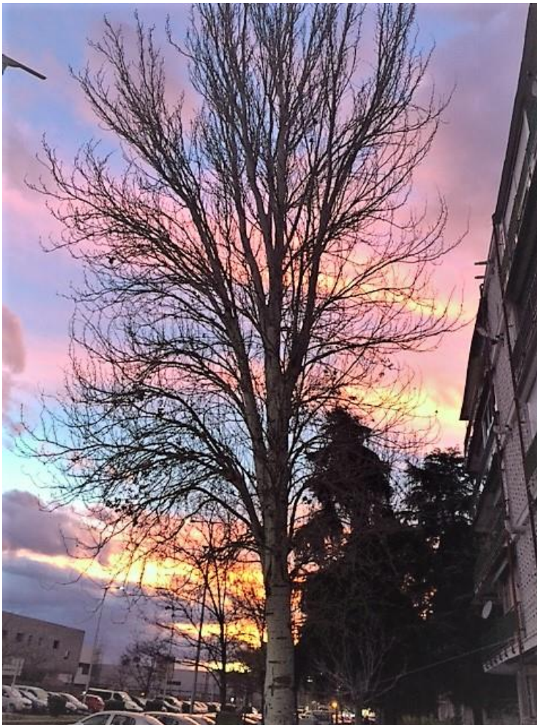
Ejemplar de gran porte sin podar desde hace tiempo

Creemos sinceramente que las campañas de poda que se realizan deben mejorar considerablemente, para ello las fuerzas políticas de la Corporación debemos alcanzar un consenso que desde nuestro grupo les ofrecemos desde ya con esta moción.